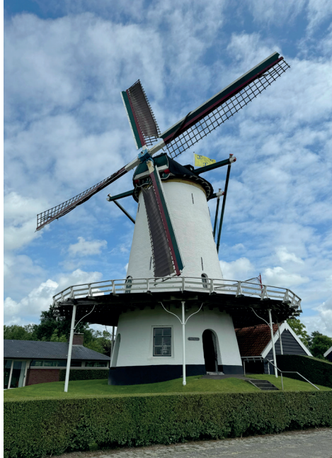
⬆ Oostmolen, Kloetinge