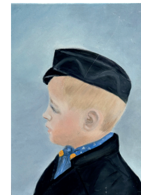
<< Schilderijen uit de expositie in de Westerkerk