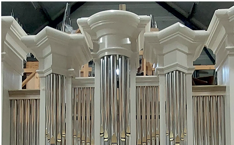
⚡ Orgel in aanbouw familie Nijse, Oud-Sabbinge