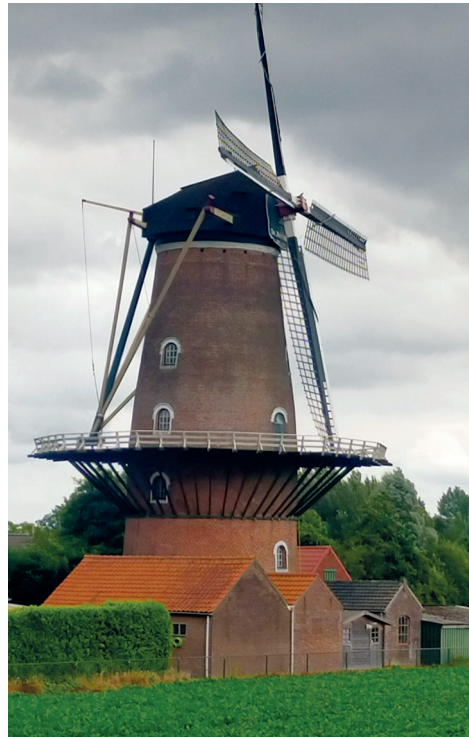
⬆ De Koutermolen, Hoedekenskerke

Molen De Koutermolen is een korenmolen uit 1874 gelegen aan de Molenstraat in Hoedekenskerke. Het is een ronde stenen grondzeiler en heeft een vlucht van 23,80 meter. Tot 1964 werd er beroepsmatig gemalen. Tegenwoordig gebeurt het malen van graan op vrijwillige basis. Molen De Koutermolen is op zaterdag van negen tot vijf te bezichtigen.