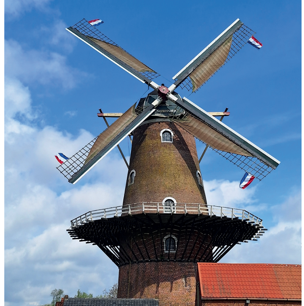
⬆ De Korenhalm, 's-Gravenpolder